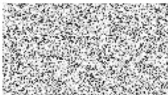
úseku stavebního úřadu

Stavba nesmí být zahájena, dokud stavební povolení nenabude právní moci. Stavební povolení pozbývá platnosti, jestliže stavba nebyla zahájena do 2 let ode dne, kdy nabylo právní moci.