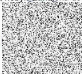
otisk úředního razítka